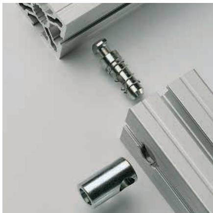
1. Querstück in die Bohrung des Anbauprofils einstecken.