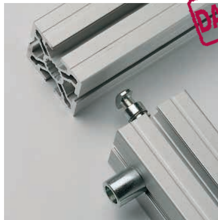
2. Anker mit aufgesteckter Rückstossfeder in die Mittelbohrung des Querstückes fügen.