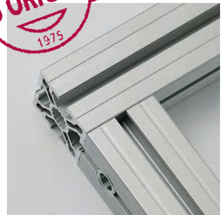
3. Ankerkopf in die Längsnut des Gegenprofils einschieben oder einstecken und abdrehen, die Innensechskantschraube anziehen – fertig.